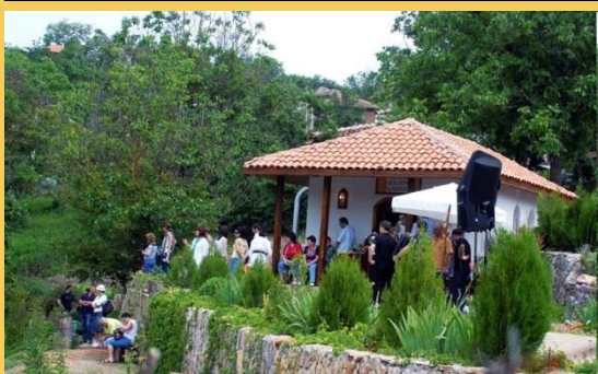
Село Бяла Вода. Освещаване на Параклиса Св. Петка Параклис Св. Иван Рилски -снимката долу

Информационен сайт на ДПП „Странджа“ http://www.strandja.bg