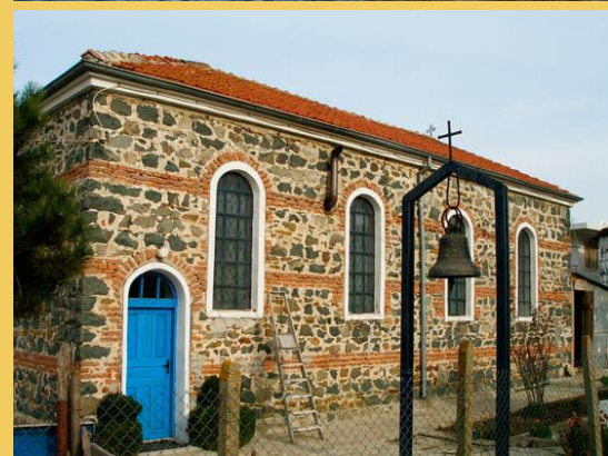
С. Синеморец- Устието на Велека и Църквата в с. Синеморец

Информационен сайт на ДПП „Странджа“ http://www.strandja.bg