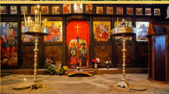
Село Бръшлян, Община Малко Търново