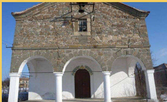
Църквата в с. Орлинци, Община Средец